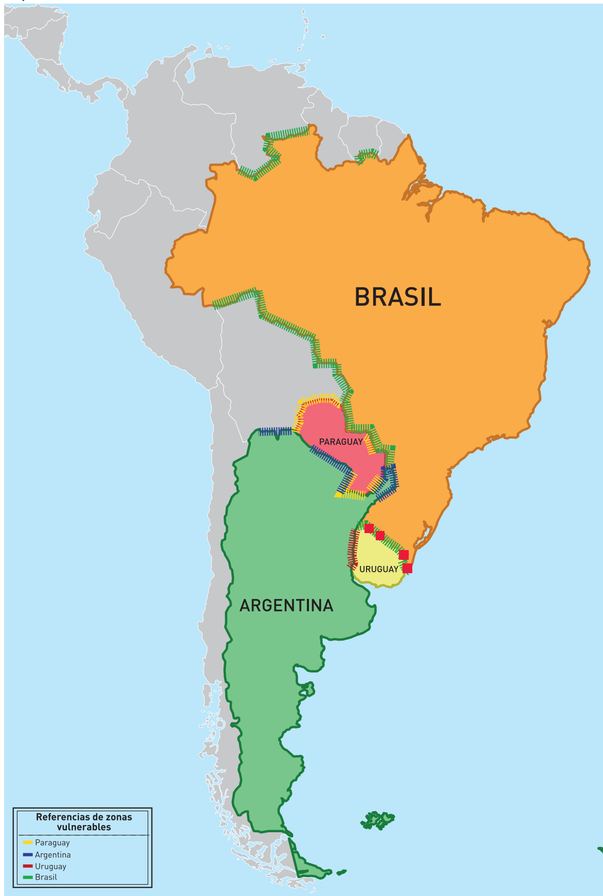
Mapa IV: Fronteras vulnerables