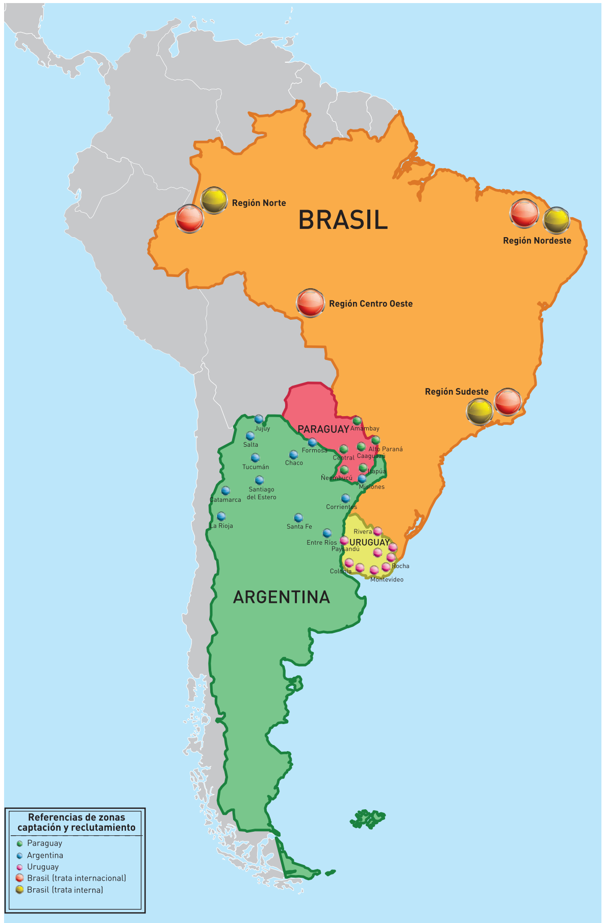
Mapa I: Principales zonas de captación y reclutamiento en la región