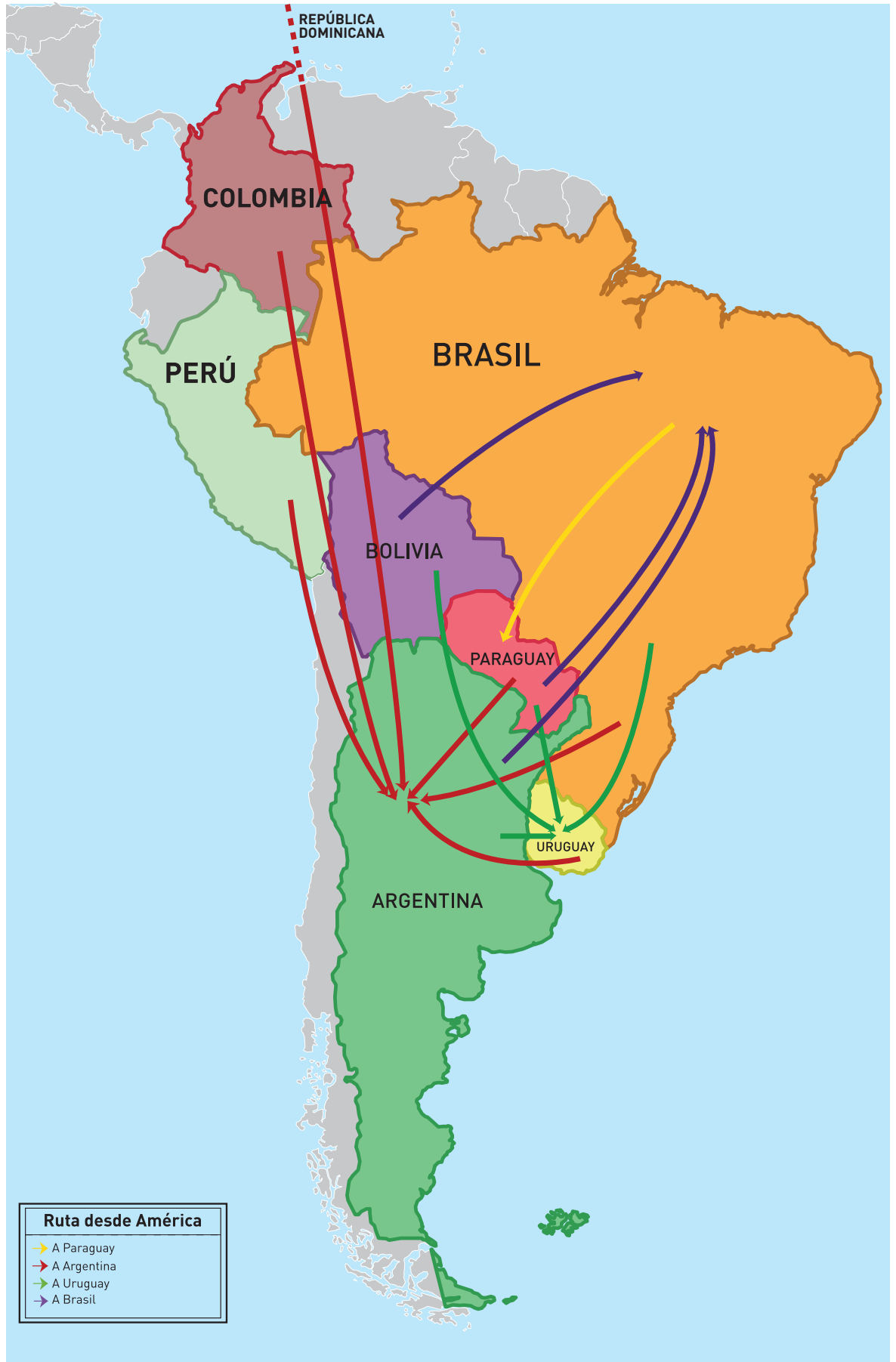
Mapa III: MERCOSUR como zona de destino